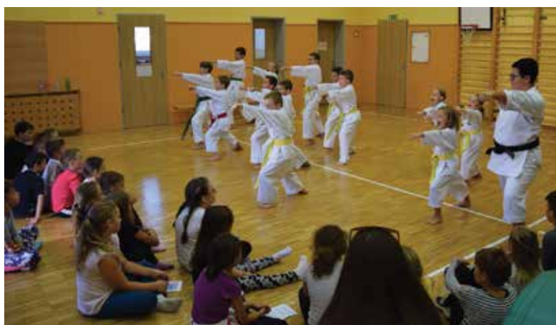
Učenci so predstavili šport borilnih veščin - karate. / Gli alunni hanno dimostrato l'arte marziale del karaté.