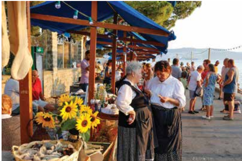
Poletje v Ankaranu smo sklenili z Ištrijanskim dnevom. / Il festival Estate ad Ancarano si è concluso con la Giornata istriana

Občina Ankaran, Oddelek za družbene dejavnosti / Comune di Ancarano, Dipartimento attività sociali