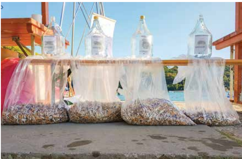
Zbrani cigaretni ogorki po občinah, od leve proti desni: Koper, Izola, Piran in Ankarano. / La quantità di mozziconi di sigaretta raccolti per comune, da sinistra verso destra: Capodistria, Izola, Pirano e Ancarano.

Anche il Comune di Ancarano ha aderito all'iniziativa, la quale assieme all'azienda Marjetica Koper ha permesso ai volontari di posteggiare gratuitamente i loro veicoli e ha fornito loro guanti e sacchetti dell'immondizia.