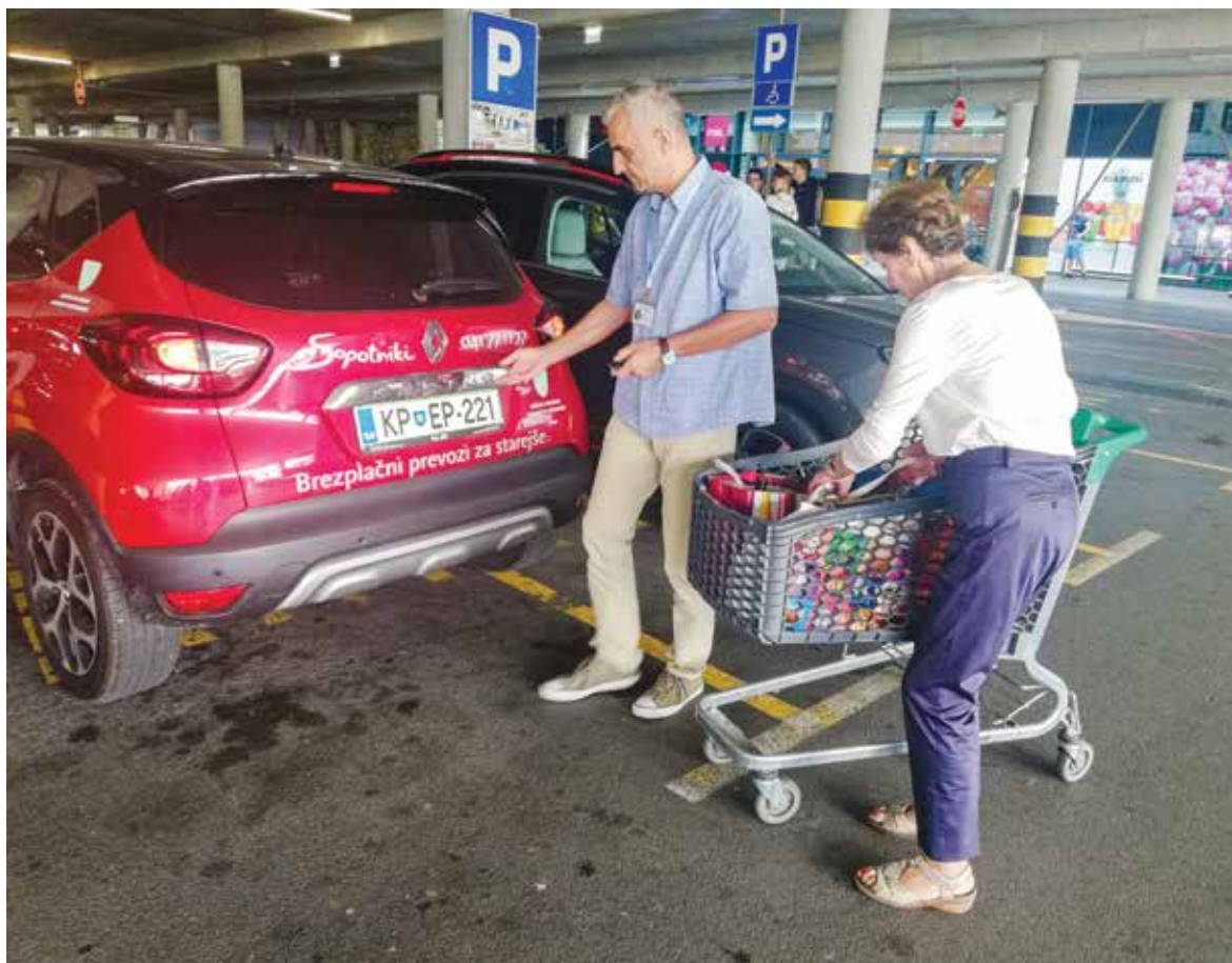
Vseslovenski akciji »Župani za volani« se je pridružil tudi ankaranski župan. / Anche il sindaco di Ancarano ha aderito alla campagna "Sindaci al volante".

Občina Ankaran, Oddelek za družbene dejavnosti / Comune di Ancarano, Dipartimento attività sociali