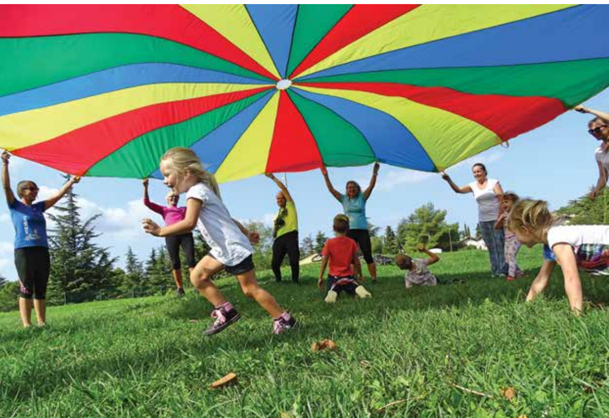
Medgeneracijsko veselje ob Mini olimpijadi. / Entusiasmo generale durante la Miniolimpiade.

La settimana sportiva è stata accolta benissimo tra la popolazione e le associazioni sportive e verrà pertanto riproposta anche il prossimo anno. Ringraziamo le associazioni che vi hanno aderito proponendo ottime attività, nonché il Comune di Ancarano per il supporto finanziario offertoci.