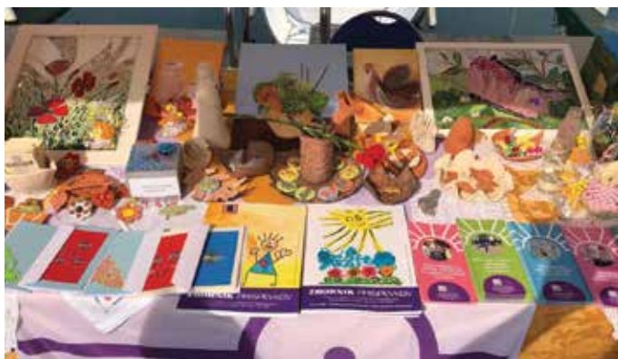
Člani društva se udeležujejo različnih dejavnosti. / I membri dell'associazione partecipano a varie attività.

Društvo invalidov Koper je invalidska organizacija, ki združuje tudi člane iz Ankarana. Je prostovoljno, neodvisno, nevladno, nepridobitno združenje za medsebojno pomoč, ugotavljanje, zagovarjanje in zadovoljevanje posebnih potreb invalidov.