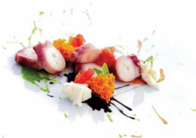
Hobotnica »caprese« z bazilikino majonezo in paradižnikovim »spongecakeom«. / Polpo »caprese« con maionese al basilico e spongecake al pomodoro.