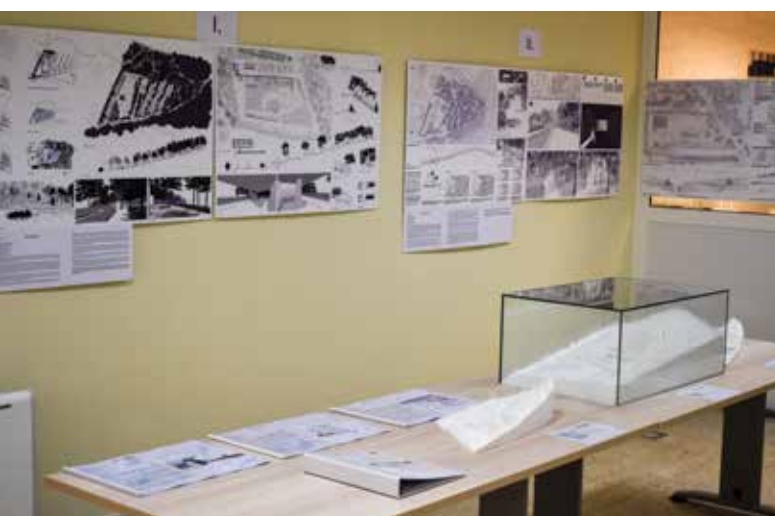
Občani in zainteresirana javnost so si na sedežu občine lahko ogledali razstavo vseh prispelih natečajnih predlogov za ureditev pokopališča. / Presso la sede del comune i cittadini ed altri interessati hanno visionato la mostra con tutte le proposte per la sistemazione del cimitero giunte a concorso.

In conformità con l'impegno del Comune di Ancarano di includere la cittadinanza in tutta la procedura di pianificazione per la sistemazione, presso la sede dell'amministrazione comunale nel periodo tra il 16 ed il 27 settembre 2019 sono state esibite tutte le soluzioni presentate con particolare attenzione alle proposte vincenti. Le prime tre di tali soluzioni vincenti erano accompagnate anche da modellini. Durante la mostra i servizi tecnici dell'amministrazione comunale hanno fornito ulteriori chiarimenti, ove necessari, nonché risposte a domande, affinché i visitatori avessero la possibilità di segnalare in un registro osservazioni e pareri. La presenza dei numerosi visitatori ha confermato la soddisfazione dei cittadini rispetto alla soluzione proposta e il loro fermo sostegno al progetto del nuovo cimitero di Ancarano.