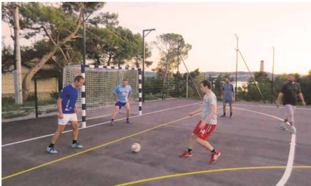
Ljubitelji iger z žogo so lahko igrali mali nogomet. / Gli appassionati dei giochi con la palla hanno potuto cimentarsi nel calcetto.

Občani in športna društva so teden športa odlično sprejeli, zato se bomo projektu pridružili tudi naslednje leto. Vsem sodelujočim društvom se zahvaljujemo za uspešno izvedene aktivnosti, posebna zahvala pa tudi Občini Ankarano za finančno podporo projektu.