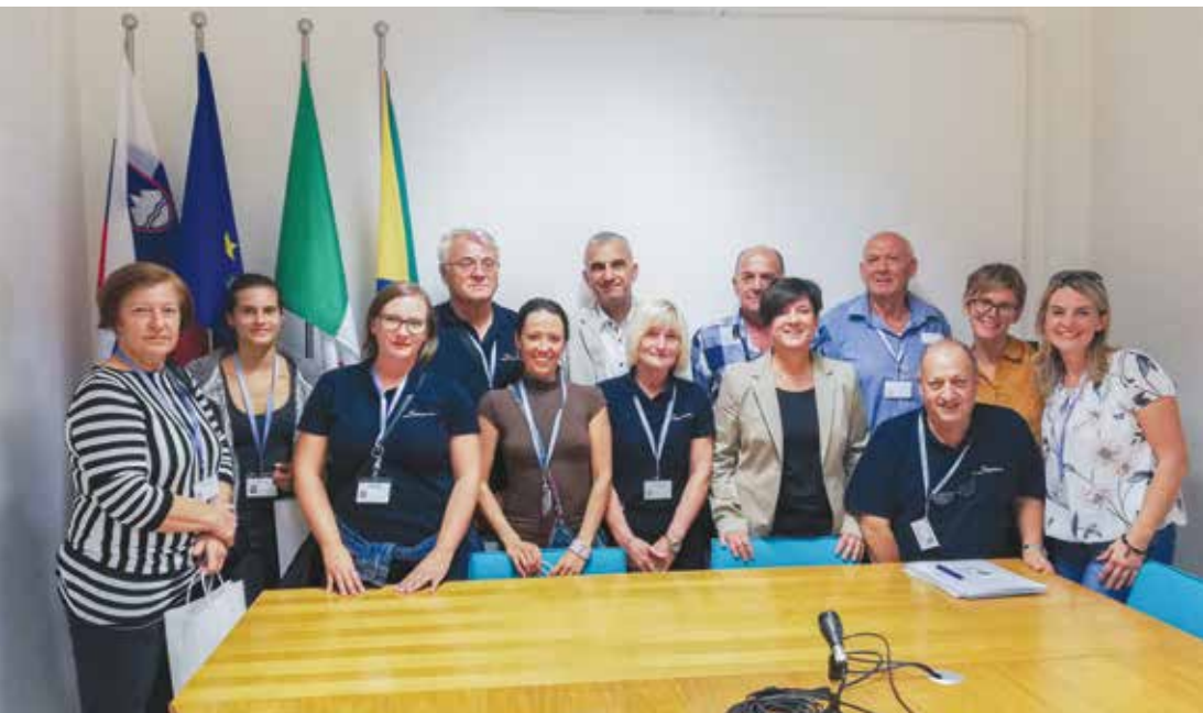
Občina Ankaran je v zahvalo za svoje delo sprejela ankaranske prostovoljce projekta Sopotniki. / Il Comune di Ancarano ha accolto e ringraziato i volontari ancaranesi dell'ente Sopotniki per l'attività svolta.

ma offre ai volontari un pranzo gratuito, mentre il bar Kavarna.net un caffè.