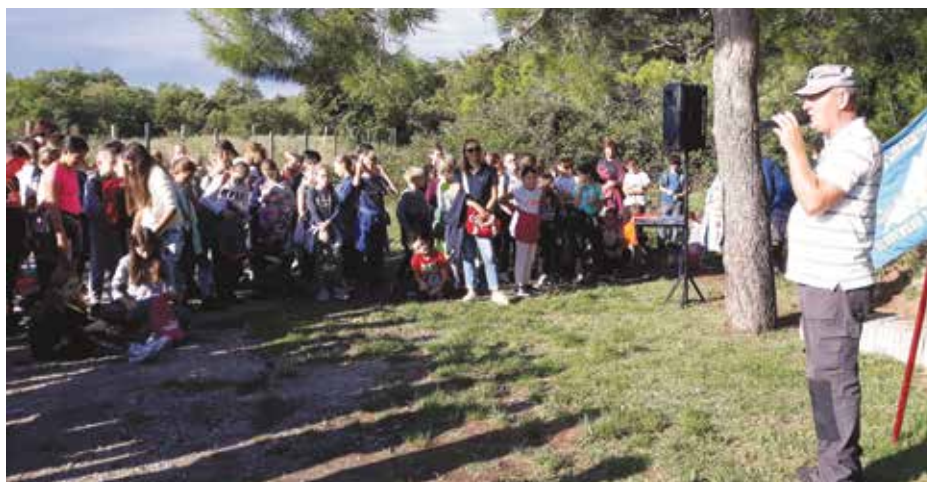
24. septembra smo šolski dan posvetili zdravemu izkoriščanju prostega časa. / La giornata scolastica del 24 settembre è stata dedicata al modo salutare di trascorrere il tempo libero.