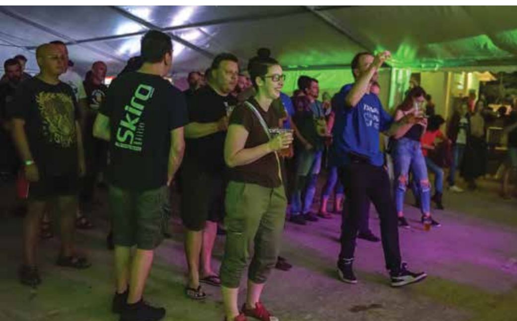
Ljubitelje alternativne glasbe so razvajali bendi iz Slovenije, Italije, Makedonije in Srbije. / Gli amanti della musica alternativa hanno apprezzato le performance di gruppi provenienti dalla Slovenia, Italia, Macedonia e Serbia.

ai musicisti sloveni, anche l'esibizione di gruppi provenienti dall'Italia, la Macedonia e la Serbia.