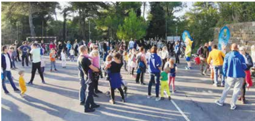
V ospredju sta bila druženje in igra. / La socializzazione ed il gioco i punti di rilievo dell'evento

Ob Tednu otroka, projektu Zveze prijateljev mladine Slovenije, so se po Sloveniji ponovno zvrstile različne razvedrilne aktivnosti za otroke. V Ankarano smo tako v četrtek, 10. oktobra, za otroke Vrtca Ankarano ter učence nižjih razredov OŠ Ankarano organizirali 2. Ankarančkov tek.