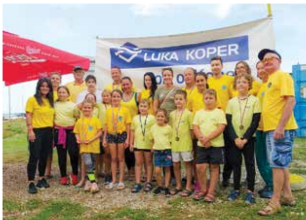
V svojih 30 letih delovanja je KKK Adria Ankarano zabeležil številne uspehe. / Nei suoi 30 anni di operato il KKK di Ankarano ha raggiunto numerosi successi.