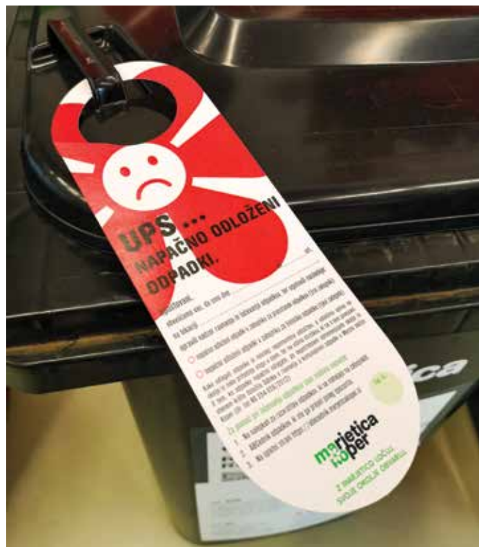
Kontrolor občane opozarja na napačno odlaganje odpadkov s podelitvijo rdečega kartona. / Con il cartellino rosso il controllore avverte i cittadini sull'erroneo smaltimento dei rifiuti.

V Marjetičinem pilotnem projektu Ločuj z nami v pižami, s katerim izobražujejo ter ugotavljajo individualne potrebe uporabnikov, sodeluje tudi Osnovna šola in vrtec Ankaran. Marjetica je tako v prostorih zavoda namestila dodatne zabojnike za ločeno zbiranje odpadkov. Projekt sicer zajema tudi večstanovanjska naselja, šole ter individualne hiše na podeželju in mestu.