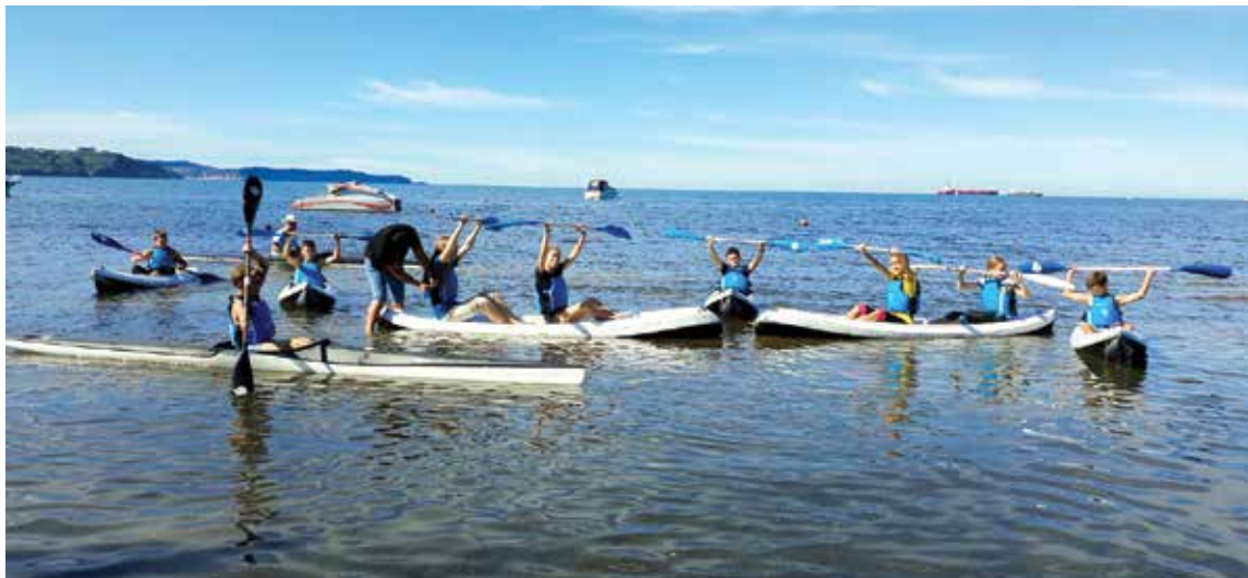
Učenci so s številnimi dejavnostmi spoznavali različne plati zdravega življenja. / Attraverso molte attività, gli alunni hanno appreso i diversi aspetti dello stile di vita sano.

Osnovna šola Ankarano sodeluje v projektu Zdrava šola, ki z različnimi dejavnostmi spodbuja, omogoča in krepi zdravje na vseh področjih. Tako smo 24. septembra šolski dan posvetili zdravemu izkoriščanju prostega časa. Naši učenci so veslali, igrali odbojko in nogomet, vadili gibe telesa in vihtenje paličice pri twirlingu, spoznavali različne prijeme pri karateju in judoju, spoznavali strelsko športno dejavnost in šli na pohod po dveh sprehajalnih poteh našega domačega kraja; po Beblerjevi poti in Resljevem gaju. Na slednji so nas spremljali člani ankaran-