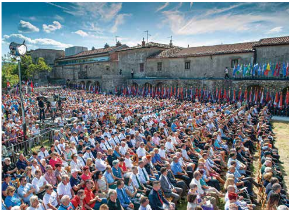
Osrednje proslave ob 72. obletnici priključitve Primorske matični domovini se je udeležilo preko 5.000 obiskovalcev. / Oltre 5.000 visitatori hanno partecipato alle celebrazioni in occasione del 72° anniversario dell'annessione del Litorale alla Madrepatria.

Il 14 settembre scorso si è tenuta ad Aidussina, la celebrazione del ritorno del Litorale alla Madrepatria. L'evento è stato organizzato dalle organizzazioni dei combattenti del litorale e dei veterani in collaborazione con i comuni costieri, mentre il relatore principale è stato il capo del governo Marjan Šarec .