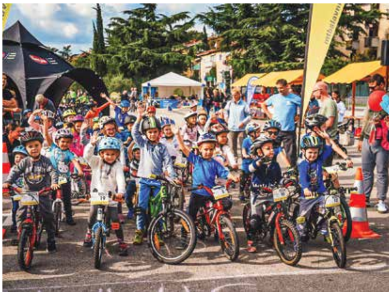
Najmlajši kolesarji so športno obarvan vikend zaključili z mini maratonom. / I più piccoli hanno concluso con una mini-maratona il weekend all'insegna dello sport.

Durante il primo finesettimana di ottobre, il centro di Ankarano ha preso vita con la Maratona ciclistica istriana e le numerose attività che l'hanno accompagnata.