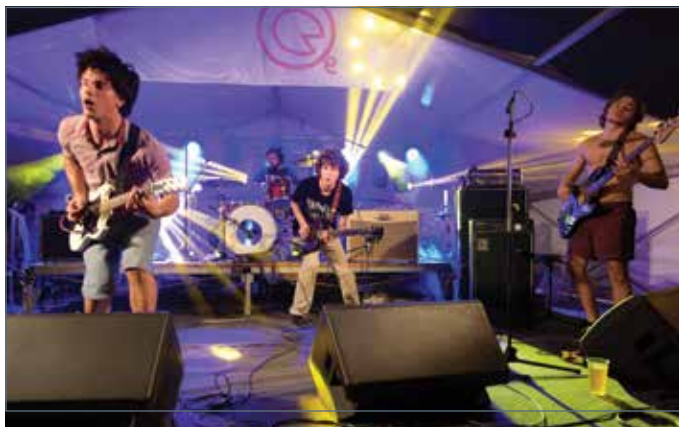
Treslo se je ob alternativnem rocku skupine Body Says No. /Vibrazioni forti per l'esibizione della band del rock alternativo Body Says No.

Zdaj že jubilejni, deseti festival, ki združuje ljubitelje alternativnih glasbenih zvrsti, je tudi letos navdušil obiskovalce iz vse Slovenije in sosednje Italije.