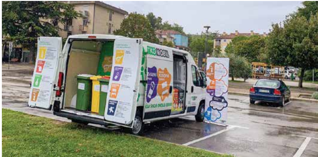
Marjetikomobil mimoidoče ozavešča o pravilnem ravnanju s komunalnimi odpadki. / La vettura promozionale »Marjetikomobil« sensibilizza i passanti sulla corretta differenziazione dei rifiuti urbani