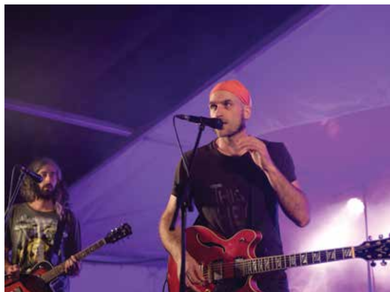
V desetih letih se je zvrstilo že več kot 60 glasbenih gostov iz vsega sveta. Na fotografiji slovenska skupina Body Says No. / Oltre 60 i gruppi musicali provenienti da tutto il mondo, che hanno partecipato al festival in questi 10 anni. Nella foto il gruppo sloveno Body Says No.

L'attività creativa dell'evento è iniziata nel primo pomeriggio con un programma per bambini, è proseguita con un torneo di pallacanestro sul molo e si è conclusa con diverse attività sportive. Per quanto riguarda la parte musicale, l'evento ha visto oltre