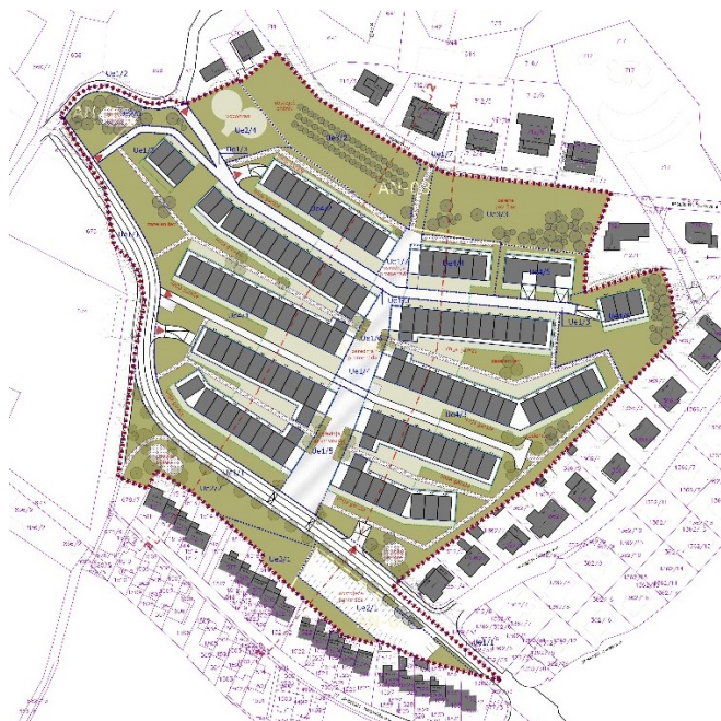
Slika 2: Prikaz umestitve načrtovane ureditve v prostor