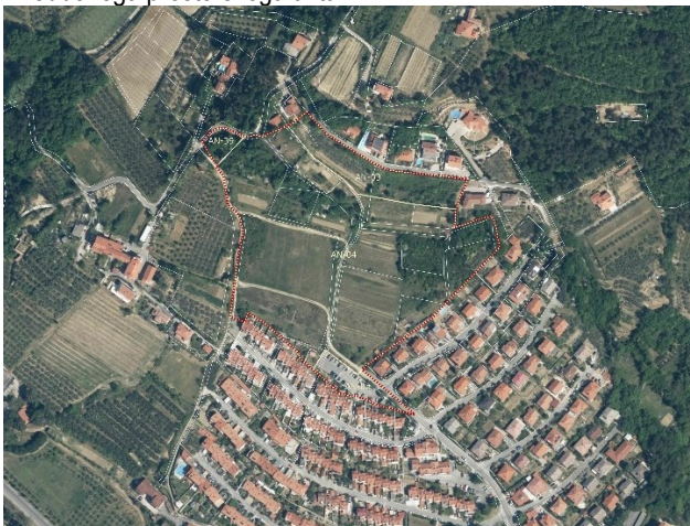
Slika 1: Prikaz območja OPPN v širšem prostoru

Pobudnik in investitor je skladno z Zakonom o urejanju prostora (ZureP-3) pripravil izhodišča (Ocena stanja in prihodnjih potreb na območju OPPN za stanovanjsko sosesko Ankaran-hrib) za nadaljnje prostorsko načrtovanje ter podal pobudo za izdelavo prostorskega akta (OPPN). S pripravo izhodišč je investitor jasno izrazil svojo investicijsko namero, hkrati pa z izhodišči pripravil tudi analizo stanja in robnih pogojev za pripravo novega izvedbenega prostorskega akta.